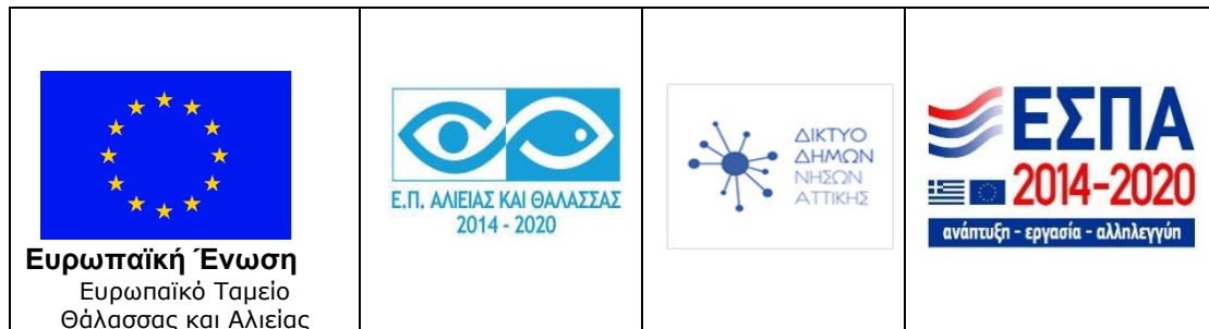
Εικόνα 7: Υπόδειγμα προωθητικού υλικού

Για μικρά διαφημιστικά αντικείμενα η αναφορά στο Ταμείο ή τα Ταμεία δεν εφαρμόζεται.