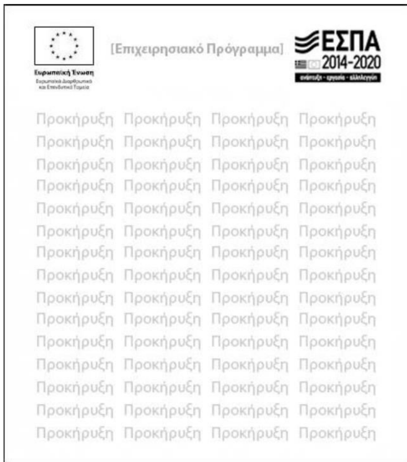
Εικόνα 1: Υπόδειγμα Πρόσκλησης / Προκήρυξης στον τύπο