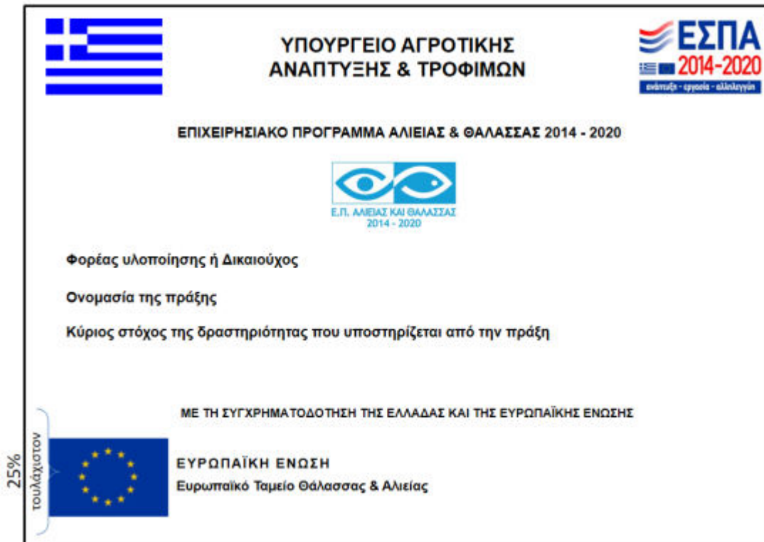
Εικόνα 4: Υπόδειγμα μόνιμης πινακίδας