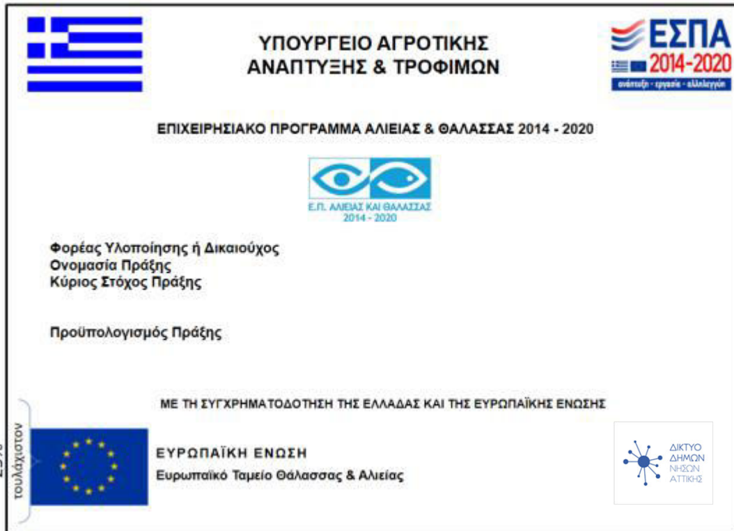
Εικόνα 3: Υπόδειγμα Προσωρινής Πινακίδας

Οι πληροφορίες που θα αναγράφονται στην πινακίδα είναι: